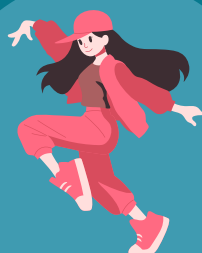
Streetdance Maandag 17:00-18:00 (5-9 jaar)