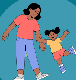
Ouder en kind gym Donderdag 09:45-10:30