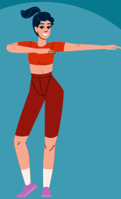
Zumba Dinsdag 18:45-19:45