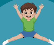
Jongens Gymnastiek Maandag 16:30-17:30