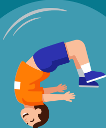
Freerun Woensdag 18:00-19:00 (beginners)